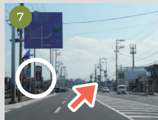
7 左にケースデンキ様、かっぱ寿司様が見えます。そのまま直進ください。