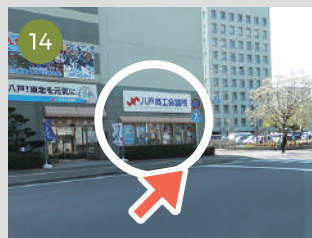
14 迂回すると、左手に商工会議所見えます。