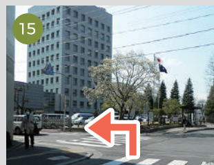
15 商工会議所を越えて左折ください。