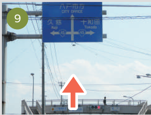
9 国道45号線へ差しかかりますが、これも直進します。交差点を越えると左側にマックがあります。