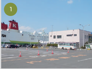
1 八戸フェリーターミナルから出発します。