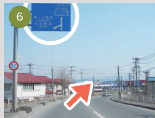
6 左折後すぐにまべち川に架かる橋を越えて、標識通りに右斜め前方へ進行します。