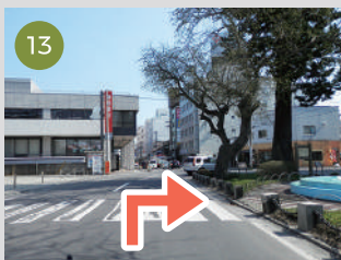
13 交番を左に見て、右に迂回します。