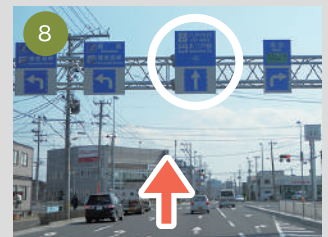
8 かっぱ寿司様を越え、さらに直進、標識通り八戸支庁方向へ。