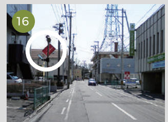
16 左折後直進、信号をひとつ越えると、当ホテルです。