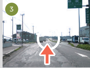
3 陸橋が見えてきます。その陸橋を下に進入してください。(左車線へ)