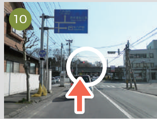
10 前方の高架線を越えてみちなりに右折し、すぐの信号を左折。高架線を超えると、右側は本八戸駅です。