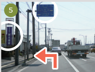
5 しばらく直進し、左に東北産業様右斜め前方に中古車店を標識通り、左折します。