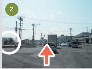
2 フェリーターミナルを出て、ひとつ目の交差点を直進、交差点左斜め前方にはローソンがあります。