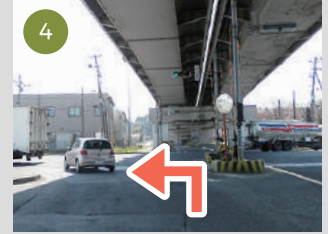
4 陸橋下を直進後、信号を左折ください。