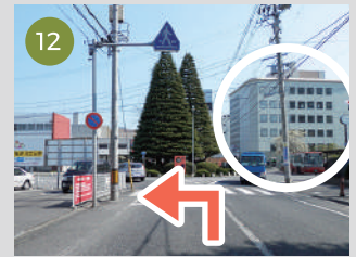
12 歩道橋を越えて、右側が市役所を見ながら、左へ進行します。左へ入ると、交番があります。(左へ入っても右車線を走行下さい)